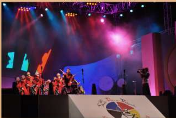
Séoul drum festival 2010 Corée du sud